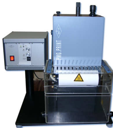
Obige Abbildung zeigt eine Sonderversion des PMG zum Bedrucken einer durchgehenden Linie von 180 mm Länge

In Kombination mit z.B. Schneidvorrichtungen wird das PMG.PRINT.50 auch für