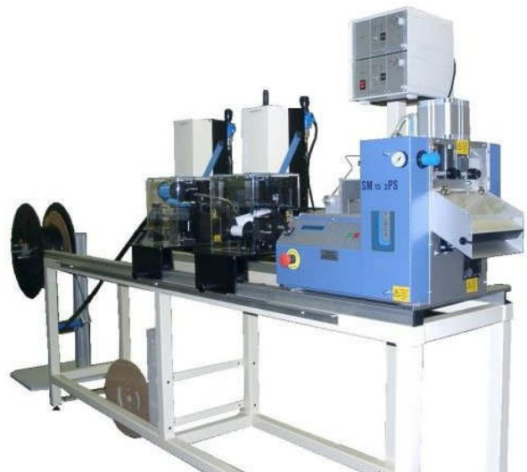
Markier- und Schneidstation für Kabel und Schläuche