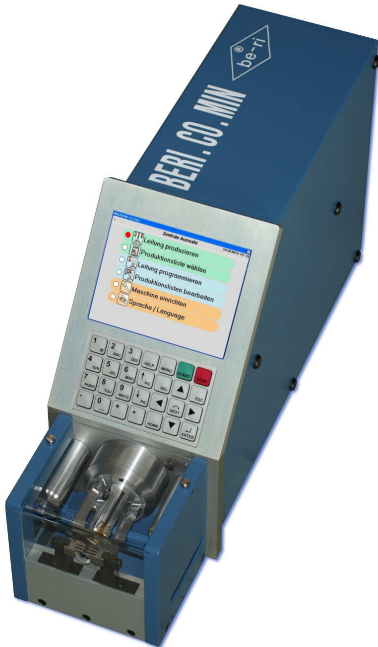
Abbildung Maschine ohne Schutzhaube