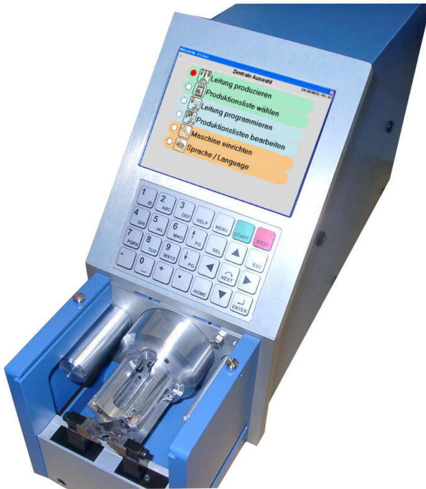
Abbildung Maschine ohne Schutzhaube